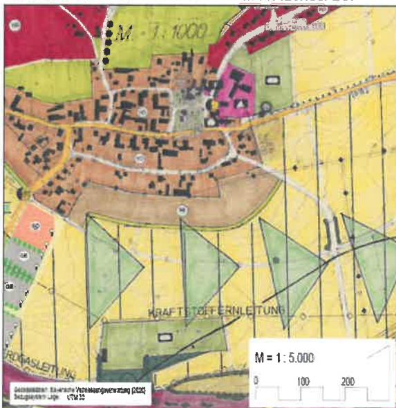
AUSSCHNITT AUS DEM WIRKSAMEN FLÄCHENNUTZUNGSPLAN

Für den Ausschnitt aus dem wirksamen Flächennutzungsplan gilt die Zeichenerklärung gemäß dem wirksamen Flächennutzungsplanes.