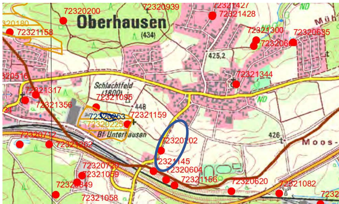
Abb. 3: Ausschnitt aus dem TK-Blatt "7232 Burgheim Nord" mit Kennzeichnung des Änderungsbereiches, o.M

Es handelt sich ausschließlich um nicht saP-relevante Arten. Aufgrund der Betroffenheit von Ackerflächen kann dennoch ein Vorkommen von gesetzlich geschützten Arten nicht grundsätzlich ausgeschlossen werden.